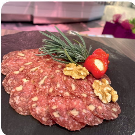
Walnusssalami luftgetrocknete hausgemachte Salami- spezialität mit Walnuss