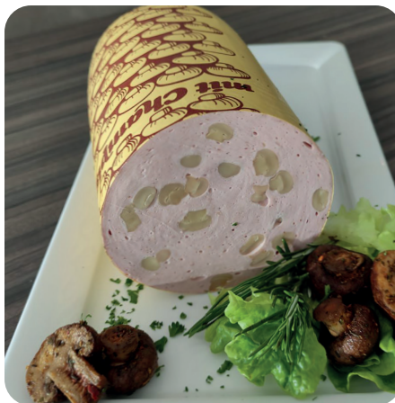
Champignonlyoner ideal aufs Vesperbrot